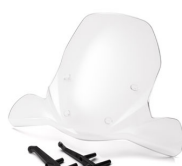
Pantalla estándar X-Enter