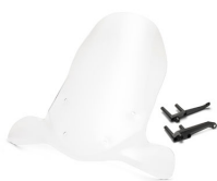
Pantalla alta X-Enter