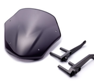
Pantalla Sport X-Enter