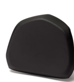
Respaldo pasajero Top Case 39L